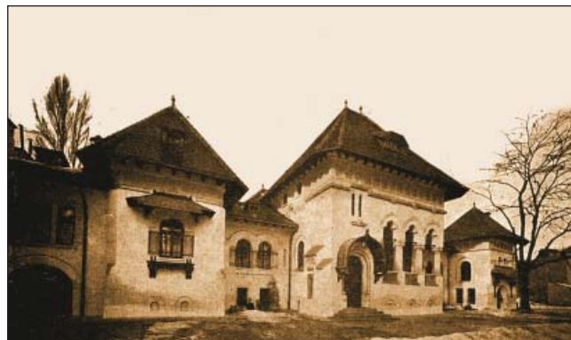
Fig. 9 - Așezămintele I. C. Brătianu din Piața Amzei, București

Cel care afirma într-un discurs, „Politica e ceva grav, grav de tot. Ai în mâna ta viața și viitorul țării tale”, a murit subit pe 24 noiembrie 1927, fiind înmormântat la Florica, alături de tatăl său. Cu dispariția sa se încheia o epocă în politica românească. Numit în epocă „vizir”, „sultan”, „sfinx”, „faraon”, „marele taciturn”, Ion I.C. Brătianu a știut ca nimeni altul să guverneze, să-și aleagă colaboratorii, să reprezinte idealurile țării sale în relațiile internaționale, conștient fiind că scrie o pagină esențială în istoria României. Criticat dur de unii dintre contemporanii săi, mulți dintre ei adversari politici, Ion I.C. Brătianu rămâne una dintre cele mai complexe personalități politice din istoria modernă și contemporană a României, rolul său în realizarea Marii Uniri și a reformelor ulterioare fiind incontestabil.