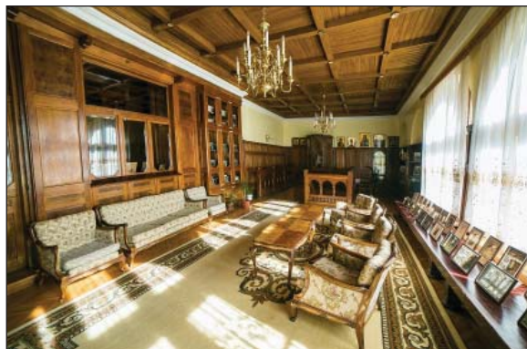
Fig. 8 - Conacul Brătianu, interior