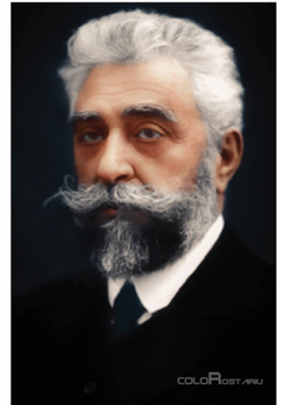
Fig. 1 - Ion I. C. Brătianu

Revenit în țară începe o impresionantă carieră politică și dobândește astfel o vastă experiență în conducerea statului. În calitate de ministru de interne în guvernul liberal care a înăbușit (reprimat) Răscoala din 1907 a realizat importanța soluționării problemei țărănești: „De problema țărănimii e legată întreaga problemă a propășirii noastre economice și politice”. În 1909 a preluat funcția de președinte al Partidului Național-Liberal de la Dimitrie Sturdza.