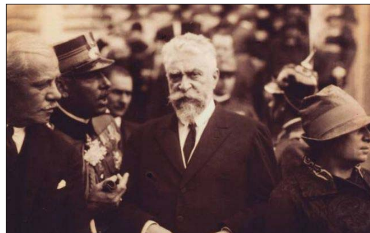
Fig. 4 - Ion I. C. Brătianu