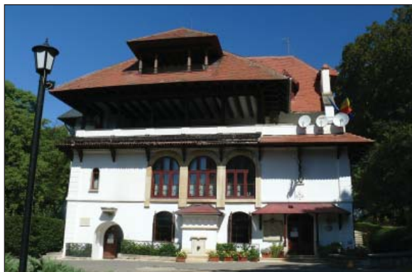
Fig. 7 - Conacul Brătianu - Vila Florica

În anul 1927, într-un climat politic foarte tensionat, Partidul Național-Liberal a câștigat alegerile, iar moartea regelui Ferdinand a complicat și mai mult situația generală a țării.