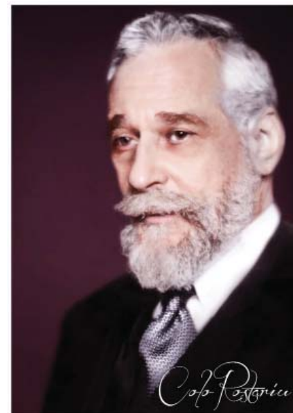
Fig. 2 - Ion I. C. Brătianu

La inițiativa lui Brătianu, regele Ferdinand a promis țăranilor soldați pământ și drept de vot. Situația dramatică a României l-a determinat să reentre în negocieri cu Germania și să tergiverseze cât mai mult posibil semnarea tratatului. Brătianu a demisionat în iarna lui 1918, iar următorul guvern condus de generalul Alexandru Averescu a încheiat un protocol de prelungire a armistițiului între România și Puterile Centrale. Ulterior, guvernul condus de Alexandru Marghiloman a semnat pe 7 mai pacea cu Puterile Centrale.