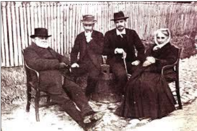
Fig. 5 - Ion I. C. Brătianu, fii Vintilă și Ionel și Pia Brătianu

În plan intern s-a confruntat cu mișcări extremiste de stânga (Partidul Comunist Român a fost scos în afara legii în 1924) și de dreapta (Mișcarea Legionară condusă de Corneliu Zelea Codreanu). De asemenea, un punct important al politicii externe a fost pe lângă asigurarea independenței și suveranității naționale, încercarea de a normaliza relațiile cu Uniunea Sovietică, prin organizarea în 1924, la Viena a unei conferințe româno-sovietice, demers eșuat însă din cauza celor două mari probleme legate de recunoașterea unirii Basarabiei cu România și restituirea tezaurului.