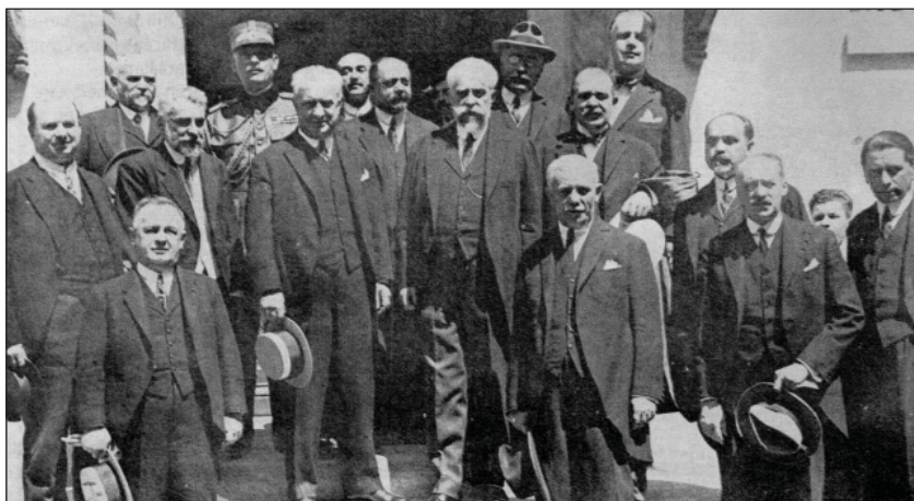
Fig. 3 - Guvernul Brătianu la investitură după moartea regelui Ferdinand, 1926