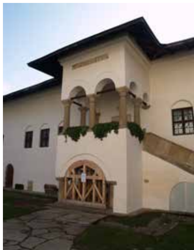
Fig. 2 Foișorul din partea de sud-est a incintei (foto 2017, arhiva INP)