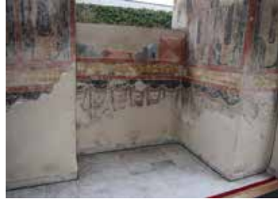
Fig. 4 Biserica „Buna-Vestire” a Mănăstirii Moldovița, probleme provocate de umiditatea de capilaritate în pridvor (foto noiembrie 2017, arhiva INP)