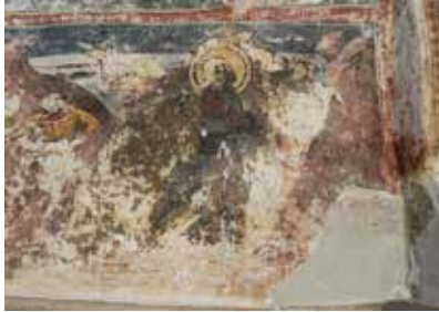
Fig. 3 Biserica „Adormirea Maicii Domnului și Sf. Gheorghe” a Mănăstirii Humor, degradări ale picturii exterioare (foto septembrie 2017, arhiva INP)