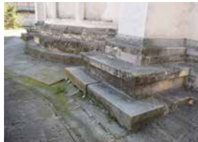
Fig. 6 Biserica „Sf. Nicolae” a Mănăstirii Proboata, starea de conservare a soclului, banchetei, trotuarului de protecție și rigolei (foto septembrie 2017, arhiva INP)