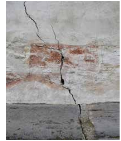
Fig. 8 Biserica „Sf. Gheorghe” a Mănăstirii „Sfântul Ioan cel Nou” din Suceava, fațada N, detaliu fisură în peretele și soclul pronaosului, (foto noiembrie 2017, arhiva INP)