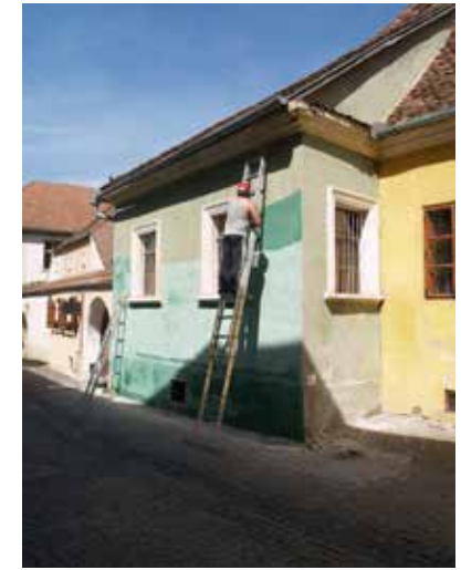
Fig. 5 Casa pe strada Bastionului (foto 2017, arhiva INP)