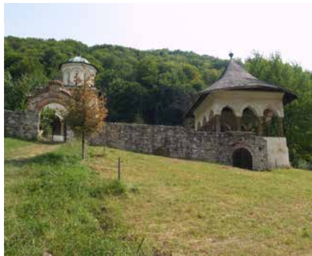
Fig. 3 Ansamblul Bolniței