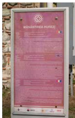
Fig. 6 Panou de semnalizare și informare (foto 2017, arhiva INP)