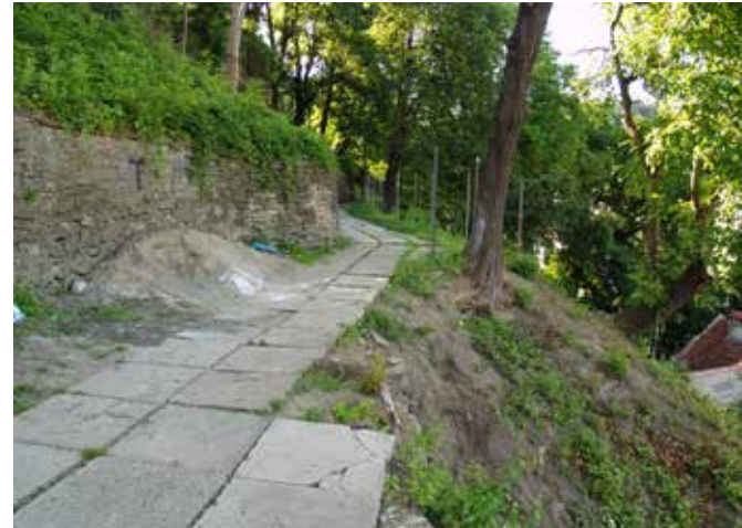
Fig. 6 Aleea de promenadă în zona estică a Cetății (foto 2017)