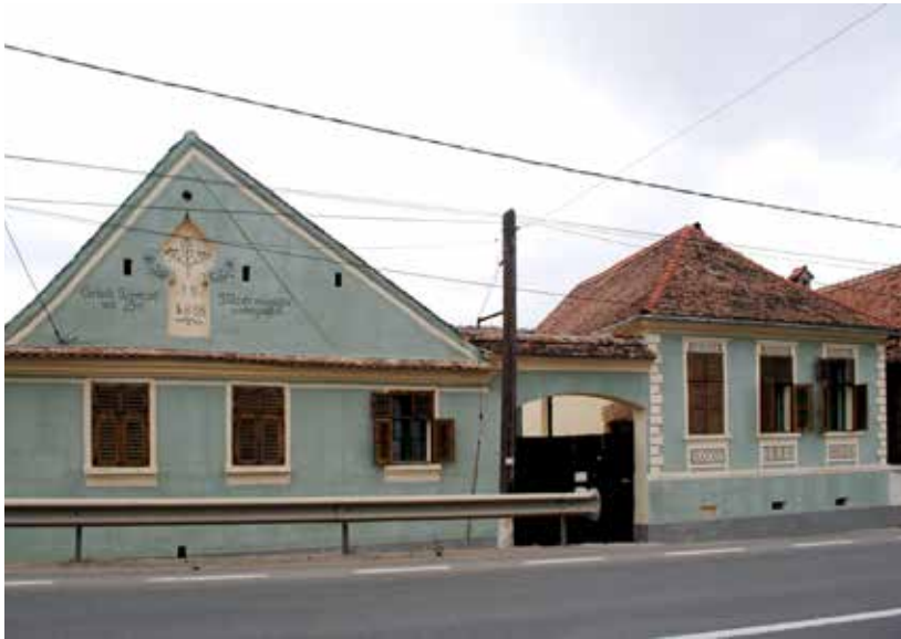
Fig.4 Saschiz. Gospodăria nr. 354 reabilitată, azi centru de producție și de desfășurare produse tradiționale. (foto 2017 arhiva INP)