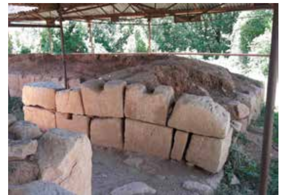
Fig. 4 Costești-Cetățuie: Turnul-locuință 2, soclu din piatră și elevație din cărămidă crudă, în curs de deteriorare accentuată