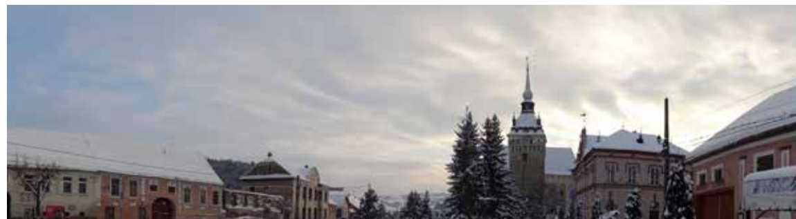
Fig.1 Saschiz. Centrul localității, cu Turnul bisericii evanghelice fortificate, ce urmează să fie restaurat prin POR; în stânga imaginii, case și clădirea fostei Școli evanghelice în stare de conservare critică

Un monument istoric înscris în Lista patrimoniului Mondial întins pe 553 ha și cu o Zonă de protecție de 3727.87 ha, cuprinzând 7 localități, cu 5 administrații județene diferite, amplasate în cadre geografice, economice și sociale diverse, fiecare cuprinzând, pe lângă ansamblul bisericii fortificate, de la 100 la 1000 de case și gospodării, clădiri ale instituțiilor tradiționale, instalații de tehnică populară, artere de circulație și cursuri de apă, plantații și amenajări istorice este imposibil de gestionat fără eforturi susținute și conjugate.