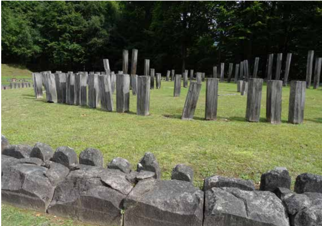
Fig. 2 Sarmizegetusa Regia: blocuri cu desprinderi de material, inelul exterior al Templului mare circular.