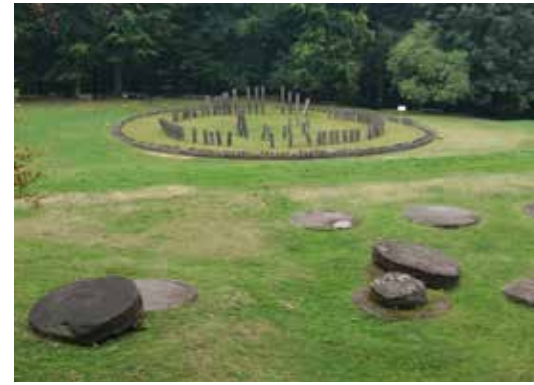
Fig. 3a Sarmizegetusa Regia: Templul mare circular, înainte de intervenție (foto septembrie 2017, P. Mortu, arhiva INP)