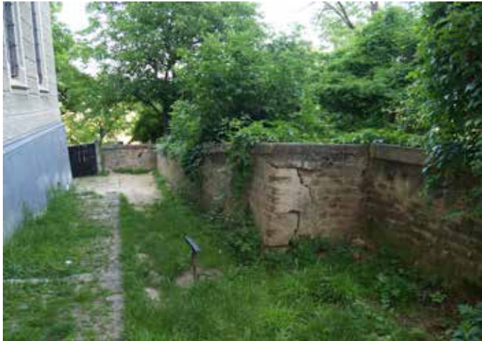
Fig. 3 Zidul de incintă în dreptul Liceului Josef Haltrich (foto 2017, arhiva INP)