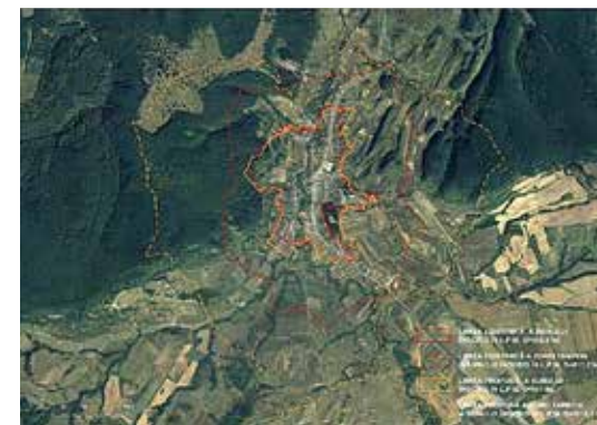
Fig.2 Saschiz. Limitele monumentului istoric înscris în LPM și a Zonei de protecție a acestuia (zona tampon) – limitele stabilite în 2010 și extinderea propusă prin PUG (2016). Proiectant și planșă „Quattro Design”