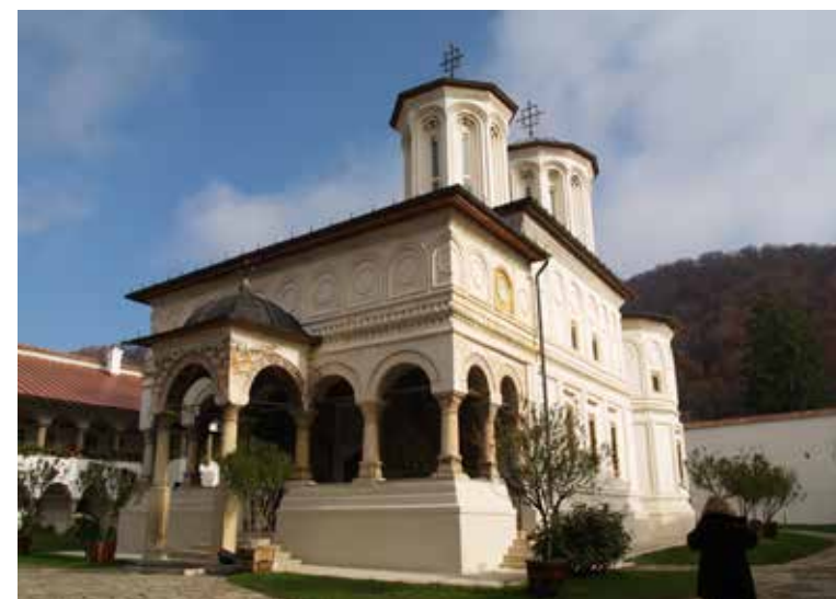
Fig. 1 Biserica Sfinții Împărați Constantin și Elena (foto 2017, arhiva INP)

Numărul de vizitatori se ridică la cca. 90.000 – 100.000 pe an. Având în vedere că mănăstirea este deschisă în cea mai mare parte a timpului, este necesar să se fixeze un program de vizitare care să nu deranjeze activitățile specifice culturii.