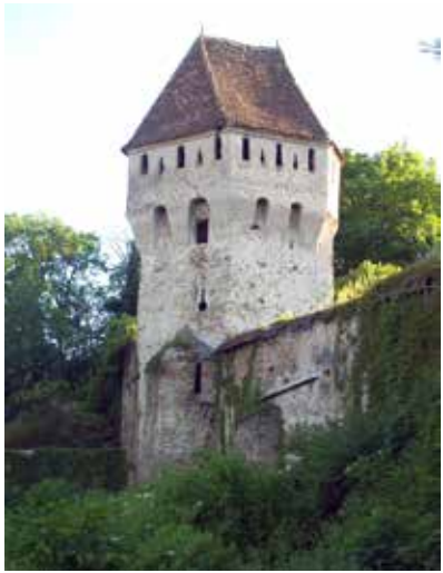
Fig. 1 Turnul Cositorarilor