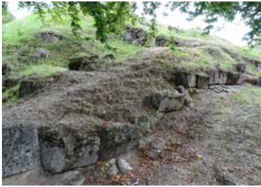
Fig. 1 Costești-Blidaru: parament destructurat între turnurile III și IV.