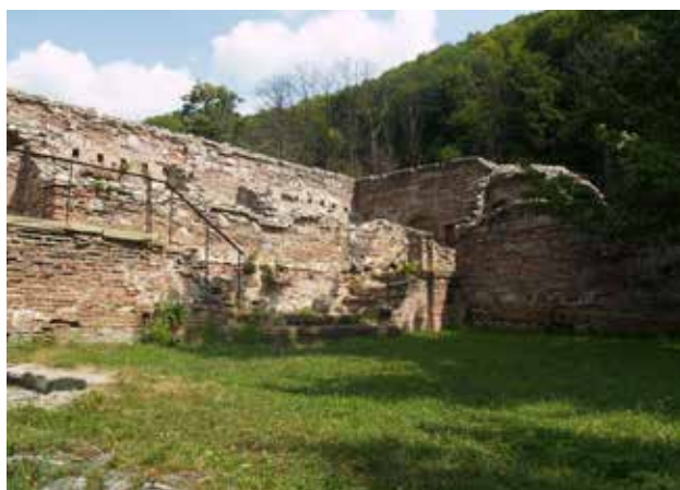
Fig. 4 Ruinele spitalului (foto 2017, arhiva INP)