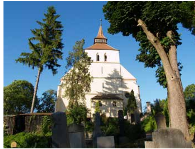
Fig. 4 Biserica din Deal (foto 2017, arhiva INP)