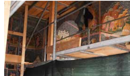
Fig. 11 Biserica „Învierea Domnului” a Mănăstirii Sucevița, intervenții de conservare–restaurare a picturii interioare (foto octombrie 2017, arhiva INP)