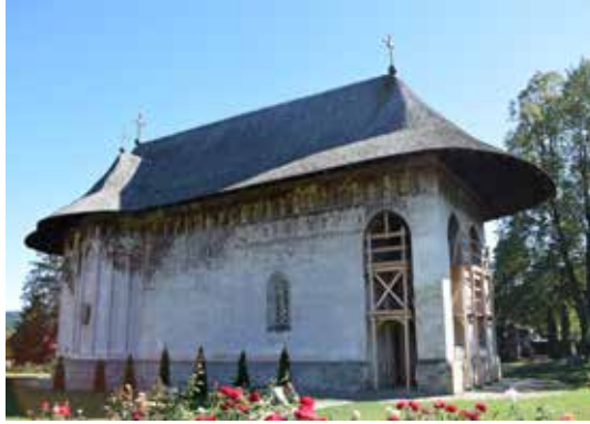
Fig. 2 Biserica „Adormirea Maicii Domnului și Sf. Gheorghe” a Mănăstirii Humor, intervenții de conservare–restaurare a picturii din pridvor (foto septembrie 2017, arhiva INP)

Biserica „Tăierea Capului Sf. Ioan Botezătorul” din satul Arbore, starea de conservare a picturii din pronaos, în zona arcosoliului, (foto octombrie 2017, arhiva INP)