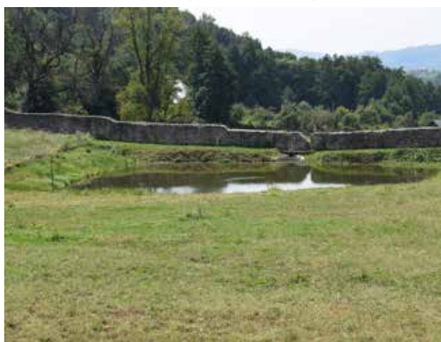
Fig. 5 Iazul (foto 2017, arhiva INP)