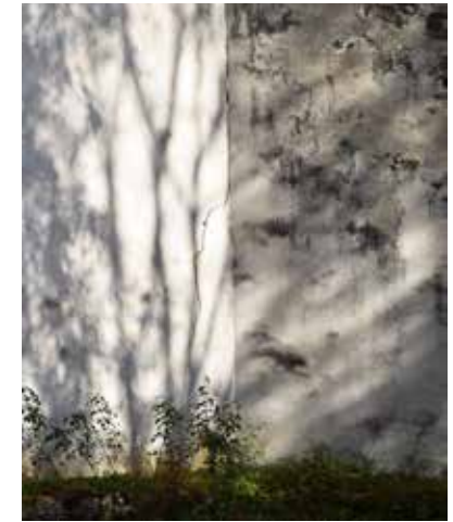
Fig. 10 Biserica „Sf. Gheorghe” a Mănăstirii Voroneț, fisură a zidului de incintă în colțul NE (foto octombrie 2017, arhiva INP)