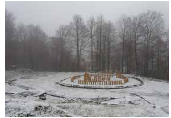
Fig. 3b Sarmizegetusa Regia: Sarmizegetusa Regia: Templul mare circular, după intervenție (foto noiembrie 2017, P. Mortu, arhiva INP)