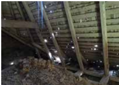
Fig. 5 Biserica „Înălțarea Sfintei Cruci” din Pătrăuți, vedere din pod ilustrând starea de conservare a învelitorii (foto octombrie 2017, arhiva INP)