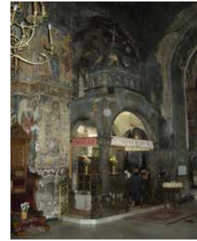
Fig. 7 Biserica „Sf. Gheorghe” a Mănăstirii „Sfântul Ioan cel Nou” din Suceava, starea de conservare a picturii din pronaos, în zona baldachinului (foto noiembrie 2017, arhiva INP)