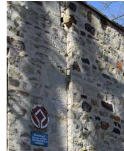
Fig. 9 Biserica „Sf. Gheorghe” a Mănăstirii Voroneț, deplasare din planul vertical a zidului de incintă în zona accesului (foto octombrie 2017, arhiva INP)