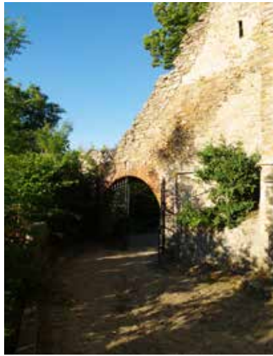
Fig. 2 Zidul în dreptul intrării în cimitirul evanghelic